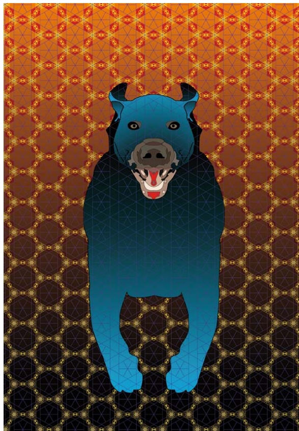
Pies na baby, 2012 – druk cyfrowy (100 x 70 cm)