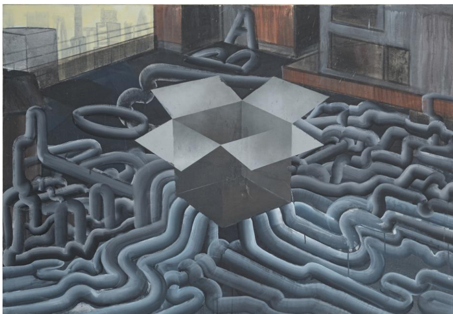
Bomba / Bomb, 2015 akryl, sprej, płótno / acrylic, spray, płótno 175 x 120 cm