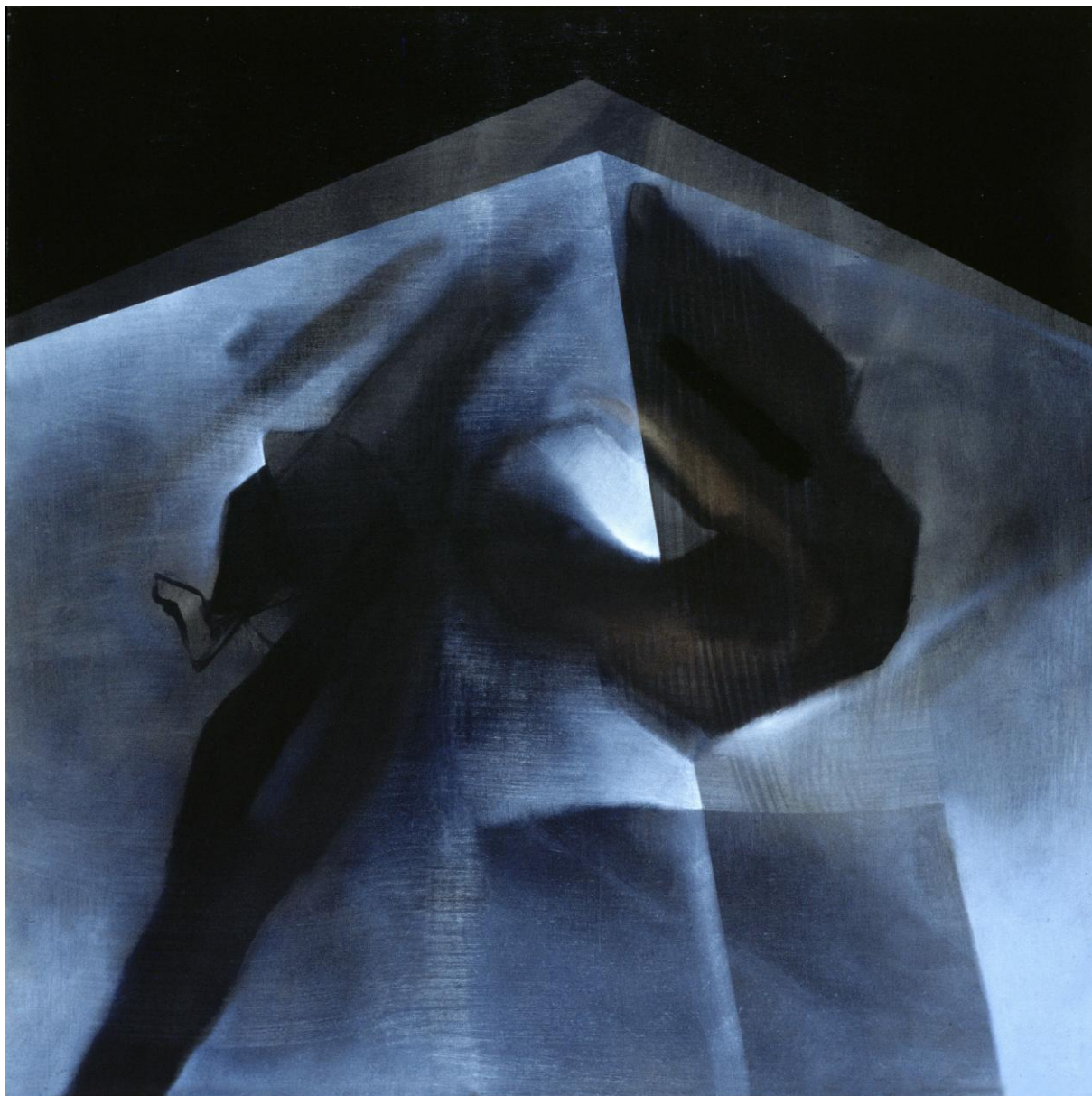
Hommage a D., 2000, olej, płótno, 100 x 100 cm

realizacji malarstwa monumentalnego. W roku 1992 eksponowała swoje prace w ramach prezentacji "Atelier 2" na weneckim Biennale Architektury. W 1999 roku otrzymała nagrodę SARP i Alcro-Beckers za malarstwo ścienne sal Cmentarza Południowego w Antoninowie. Od 1985 r. jest uczestnikiem Międzynarodowych Konfrontacji Plastycznych SŁONNE.