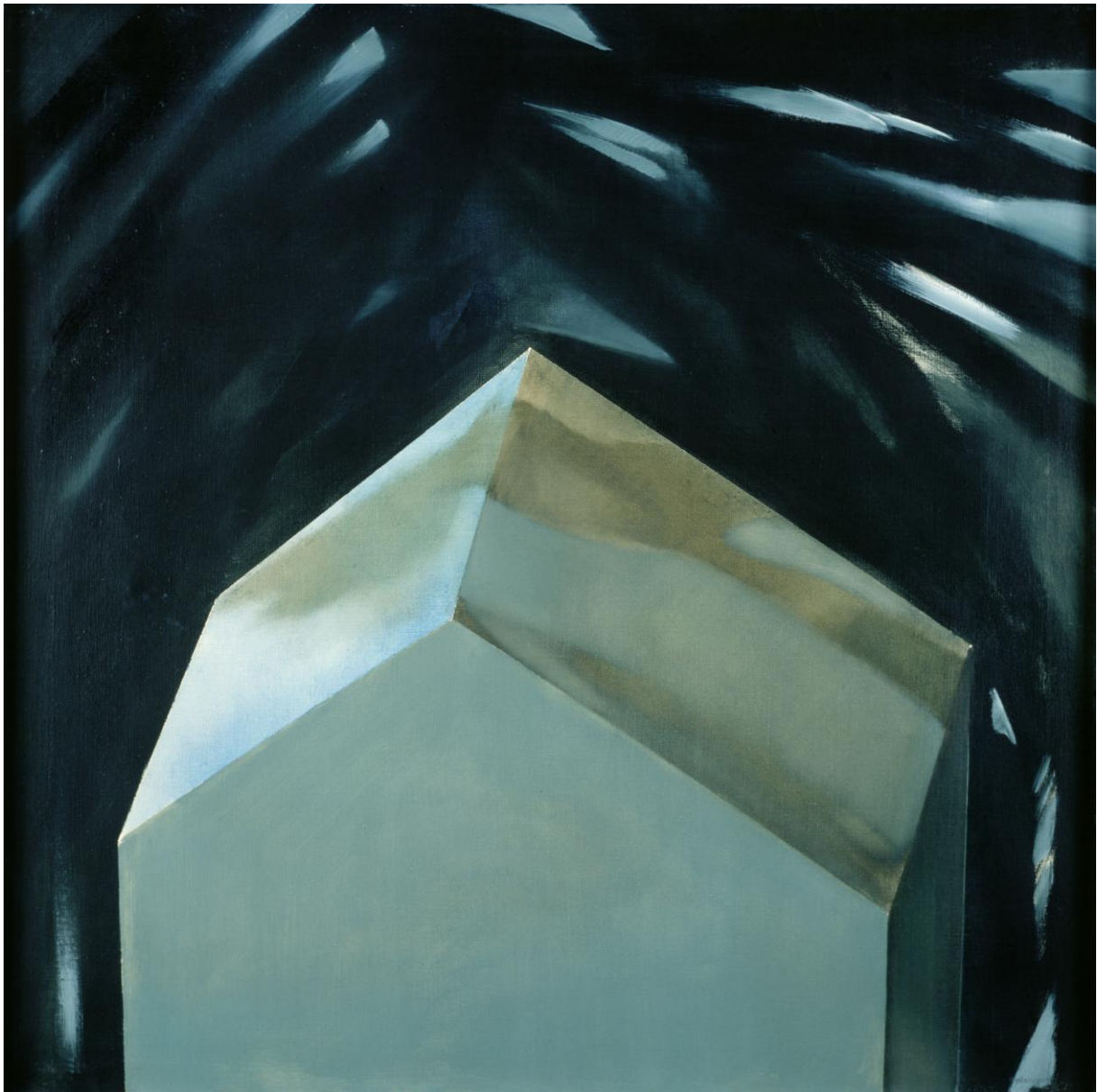
Czas zbierania kamieni, 1990

Dyscyplina geometrii i swoboda przypadku. Przesilanie się światła z ciemnością. Ciężar i lekkość. Płaszczyzny i linie. Zabieg transparentności prowadzi do odmaterializowania figur i umaterialniania przestrzeni. Anihilacja