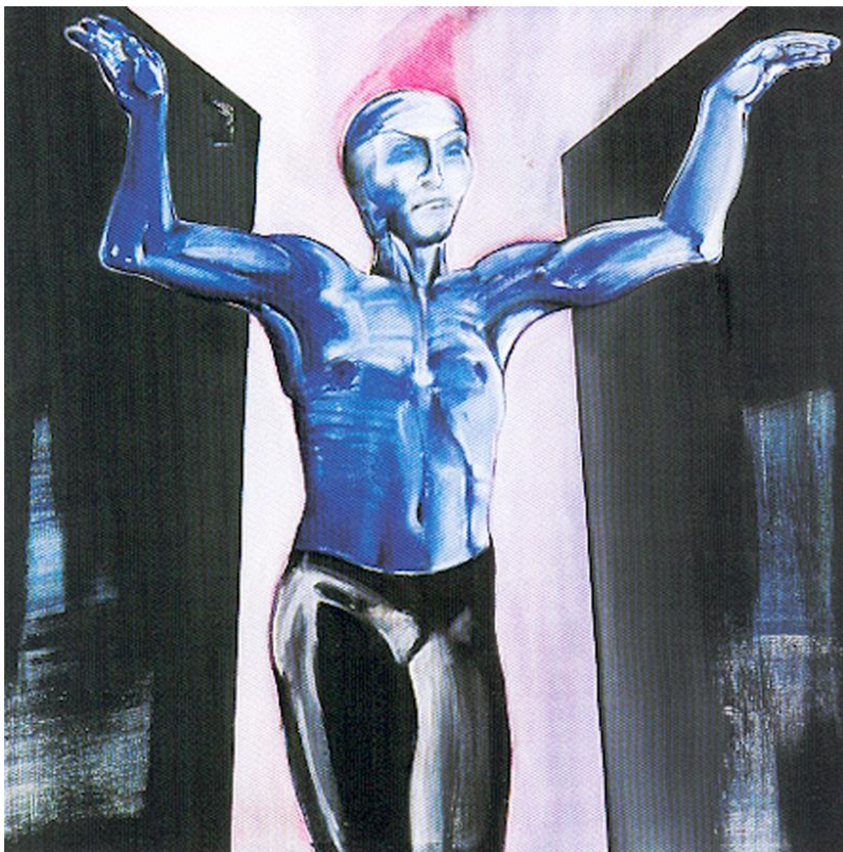
Sytuacje – Incydent 46, 1996 - technika mieszana / płótno (130 x 130 cm)

Członek Stowarzyszenia Międzynarodowe Triennale Grafiki w Krakowie i European Artists w Niemczech. W latach 1996 - 2007 wykładowca, a następnie adiunkt w Europejskiej Akademii Sztuk w Warszawie gdzie prowadził dyplomującą pracownię litografii. Obecnie profesor na Wydziale Sztuki Uniwersytetu Rzeszowskiego. W roku 2013 otrzymał Medal Komisji Edukacji Narodowej. Od roku 1997, dyrektor Galerii Sztuki Współczesnej w Przemyślu.