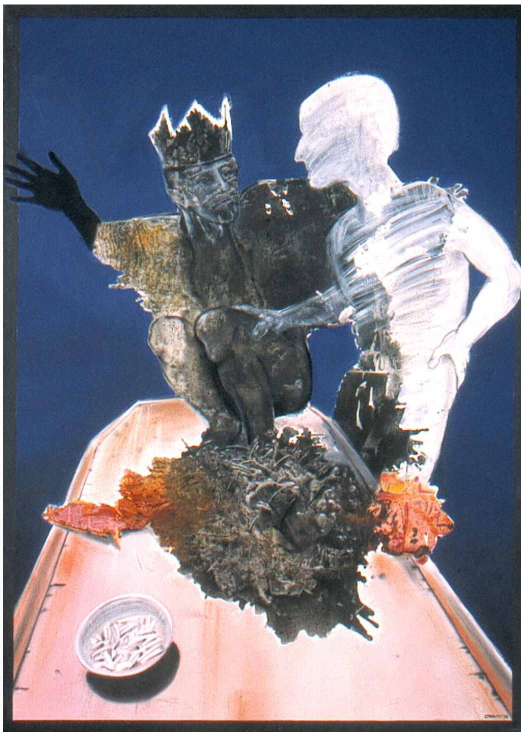
Sytuacje – Incydent 47, 1994 - technika mieszana / płótno (180 x 130 cm)

Od roku 1976 otrzymał 40 nagród i wyróżnień. Laureat - m.in.: Międzynarodowego Triennale Grafiki - Kraków '97; Nagrody Sztuki miasta Bautzen w Niemczech w 1998 r. ; Nagrody Fundacji im. M. Molnara w Vaja na Węgrzech w 2001 r.