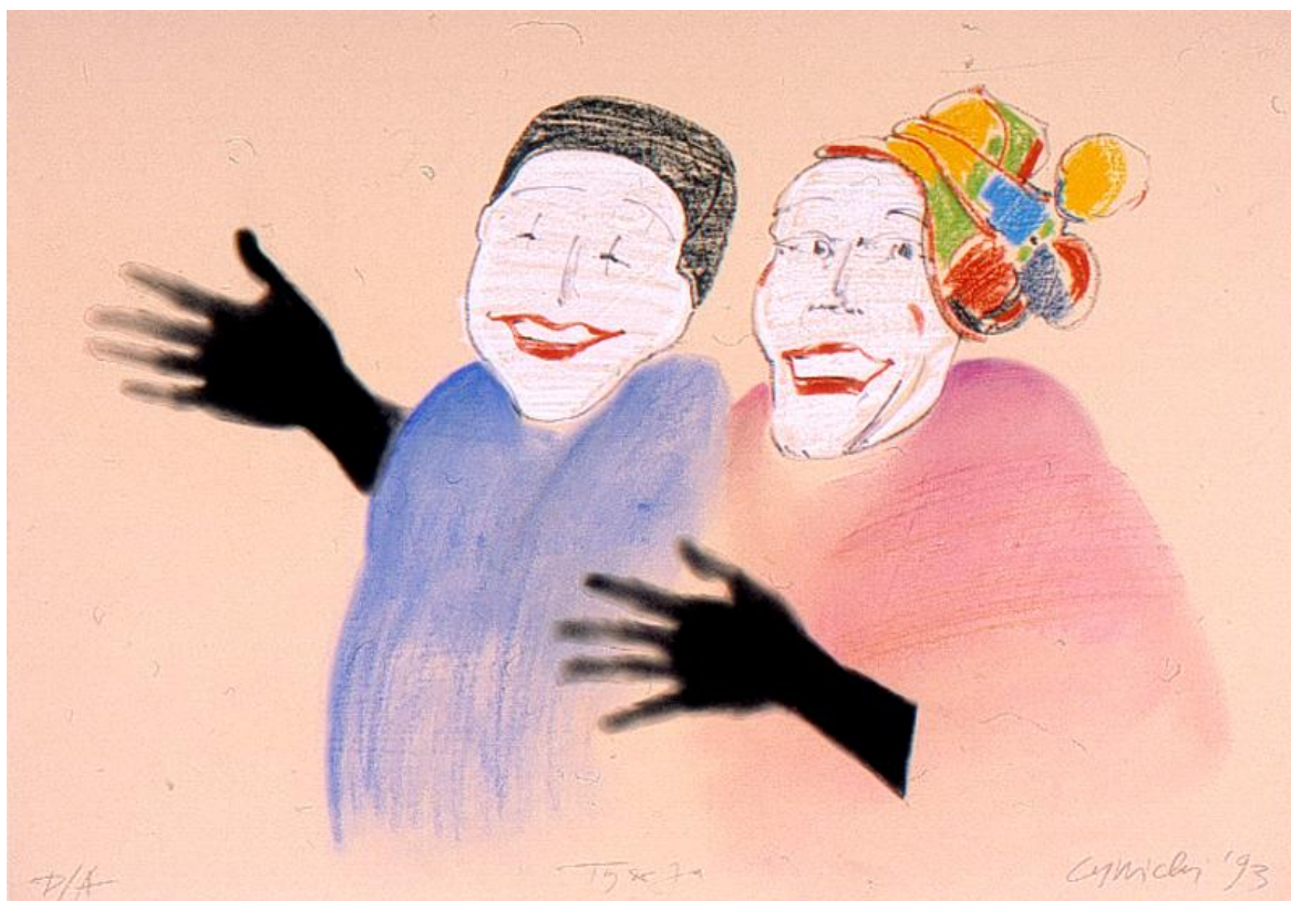
Ty i ja, 1993 - pastel / karton (70 x 100 cm)