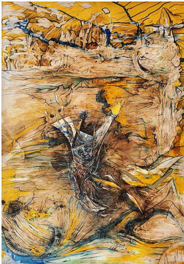
Z cyklu: NEOONIRYZM „Przemiana”, 2019 - mix-media, 100x70 cm