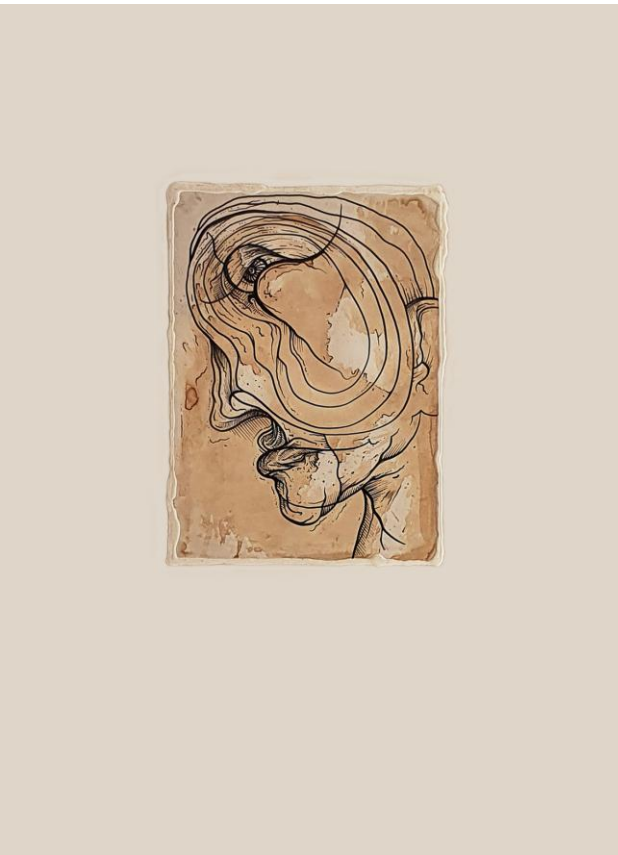
Z cyklu: NEOONIRYZM „Dysonans”, 2019 - mix-media, 50x70 cm