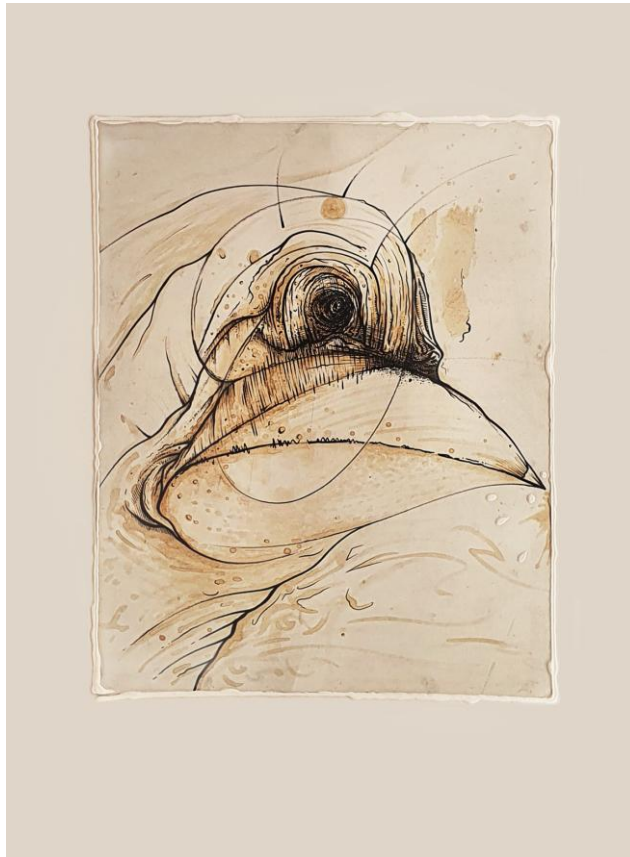
Z cyklu: NEOONIRYZM „W gnieździe”, 2019 - mix-media, 50x70 cm