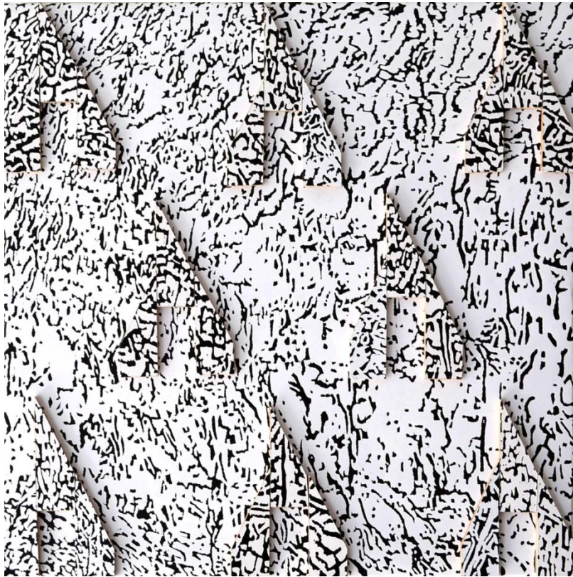
Przestrzeń czasu – XI, 2016, linoryt, technika mieszana, 30 x 30 cm

przestrzeni domaga się języka i kategorii językowych do opisu tego doświadczenia. Czasoprzestrzeń życiowa Cywickiego - sądząc z autokomentarza - niezwykle istotna, wypełniona indywidualnie rozpoznawalnymi znaczeniami, w jego sztuce poddana zostaje próbie obiektywizacji, przy świadomości jednak że jej pełne odsłonięcie nie będzie nigdy w pełni możliwe. Świat istnieje w sposób taki, w jaki nam się jawi - zmysłowo, subiektywnie i fragmentarycznie - jako przestrzeń "antropologiczna", przestrzeń doświadczenia, źródło sensu dla kreacji artystycznych.