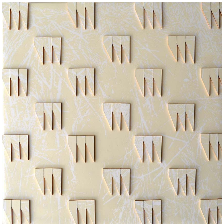
Przestrzeń czasu – VIII, 2016, linoryt, technika mieszana, 50 x 50 cm

Laureat 76 nagród i wyróżnień w konkursach w Katowicach, Przemyślu, Rzeszowie, Jeleniej Górze, Raciborzu, Poznaniu, Boguszowie-Gorcach; Cluj-Napoca; Aiud; Timisoara (Rumunia), Rijeca (Chorwacja), Paderborn (Niemcy), Tokyo (Japonia), Sint-Niclaas (Belgia), Wilno (Litwa), Ankara (Turcja), Famagusta (Cypr), Belgrade (Serbia), Shanghai; Guangzhou (Chiny), Santa Fe; Rosario (Argentyna), Varna (Bułgaria), Naantali (Finlandia), Vigonza; Padova (Włochy).