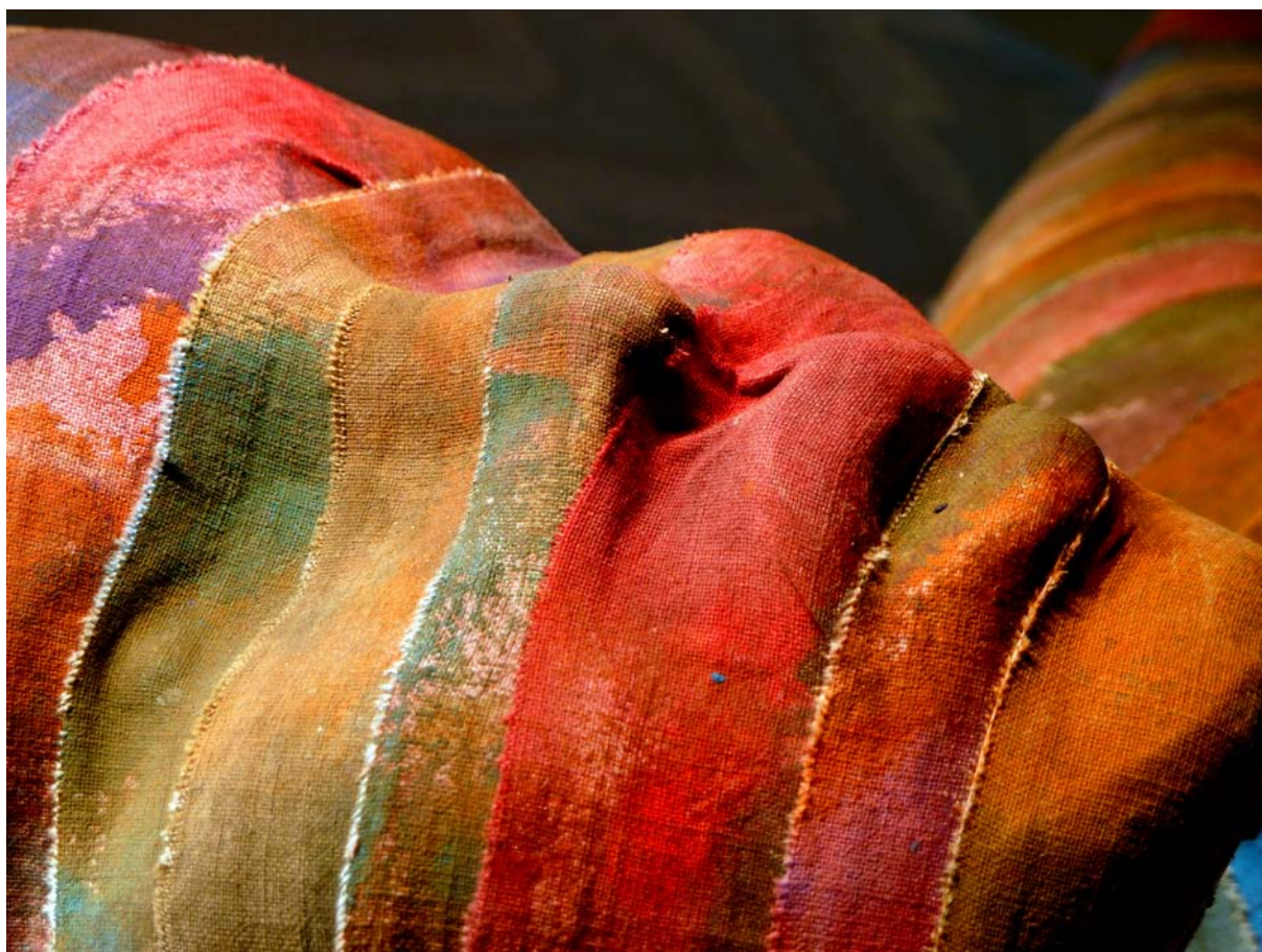
Twisted Room, 2012 - instalacja / fragmenty

Laureatka Grand Prix / 6. Międzynarodowego Biennale Artystycznej Tkaniny Lnianej "Z krosna do Krosna", Krosno 2010; Międzynarodowego Triennale Malarstwa Regionu Karpat "Srebrny Czworokąt" - Przemyśl 2009 i Dorocznej Nagrody Artystycznej im. Mariana Strońskiego - Przemyśl 2009; Stypendystka Prezydenta Miasta Przemyśla / 2007.