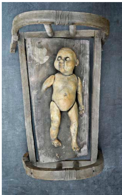
Przemijanie, 2001 - drewno (43 x 27 x 21 cm)