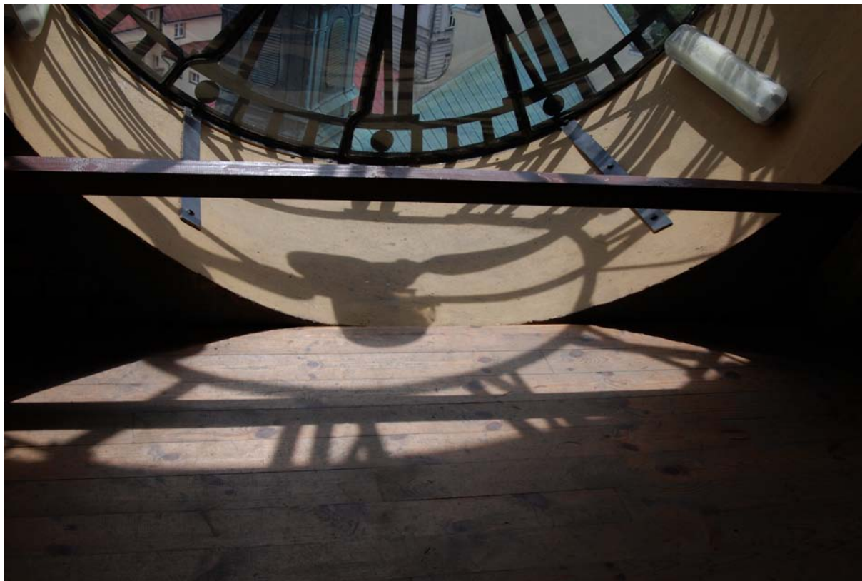
Upływ czasu w Przemyśle mieście, 2012", akcja fotograficzna